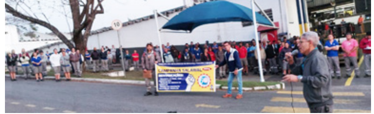
Grammer do Brasil