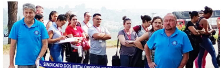
Huf do Brasil