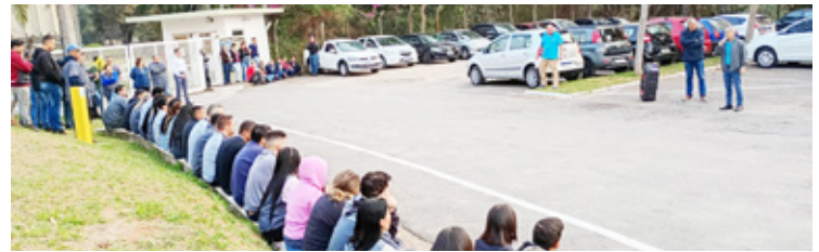
Scheuermann Heilig do Brasil