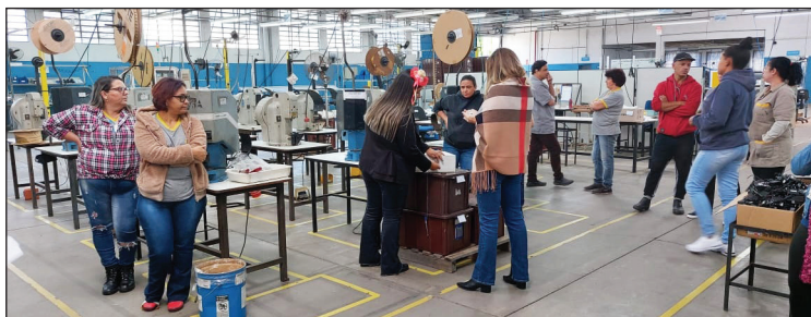
Assembleia e votação realizada na Chelb