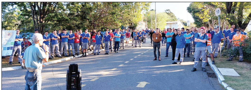
Assembleia realizada na Grammer do Brasil

Chelb - Redução de salário e jornada de trabalho.